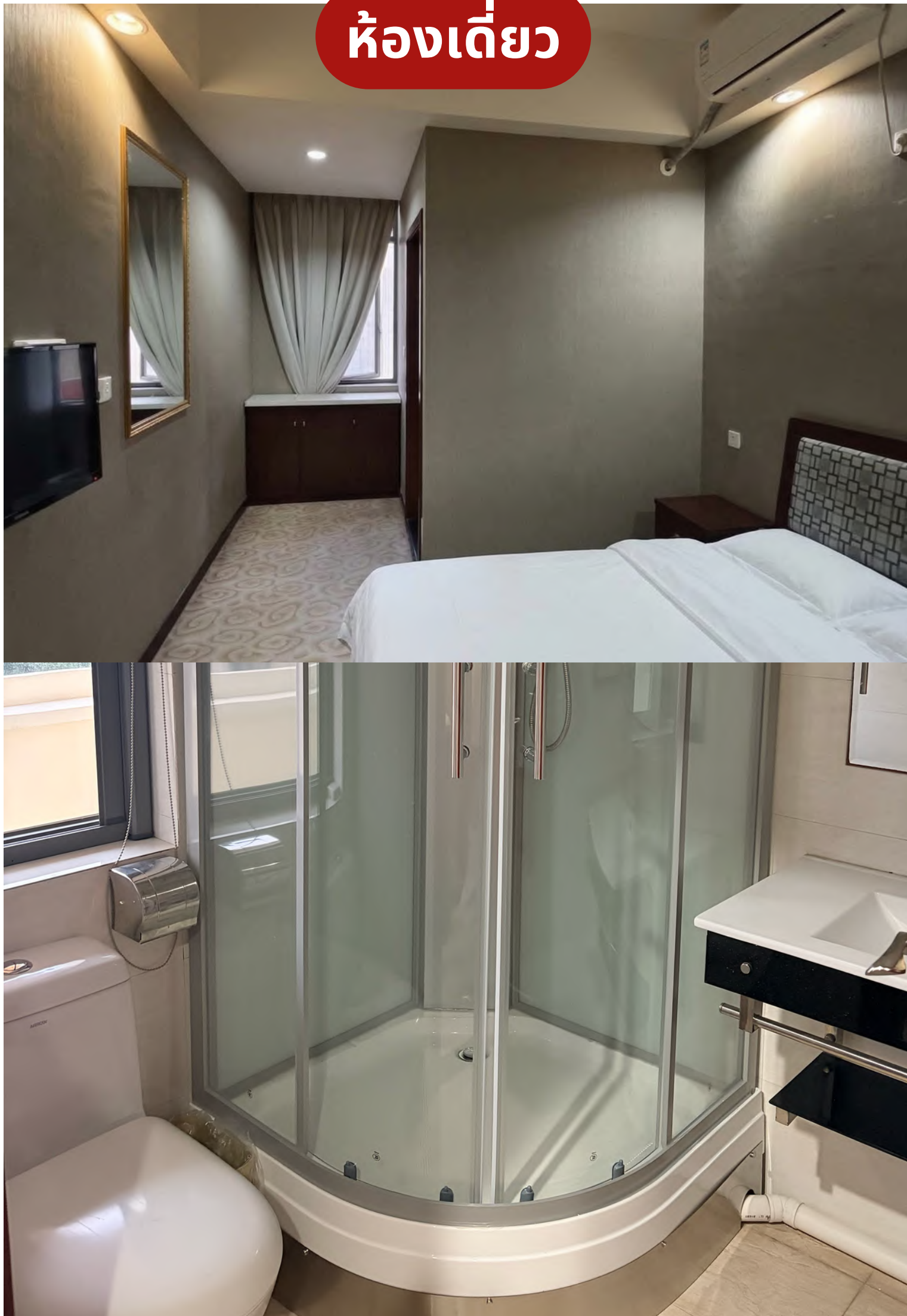
ห้องเดี่ยว