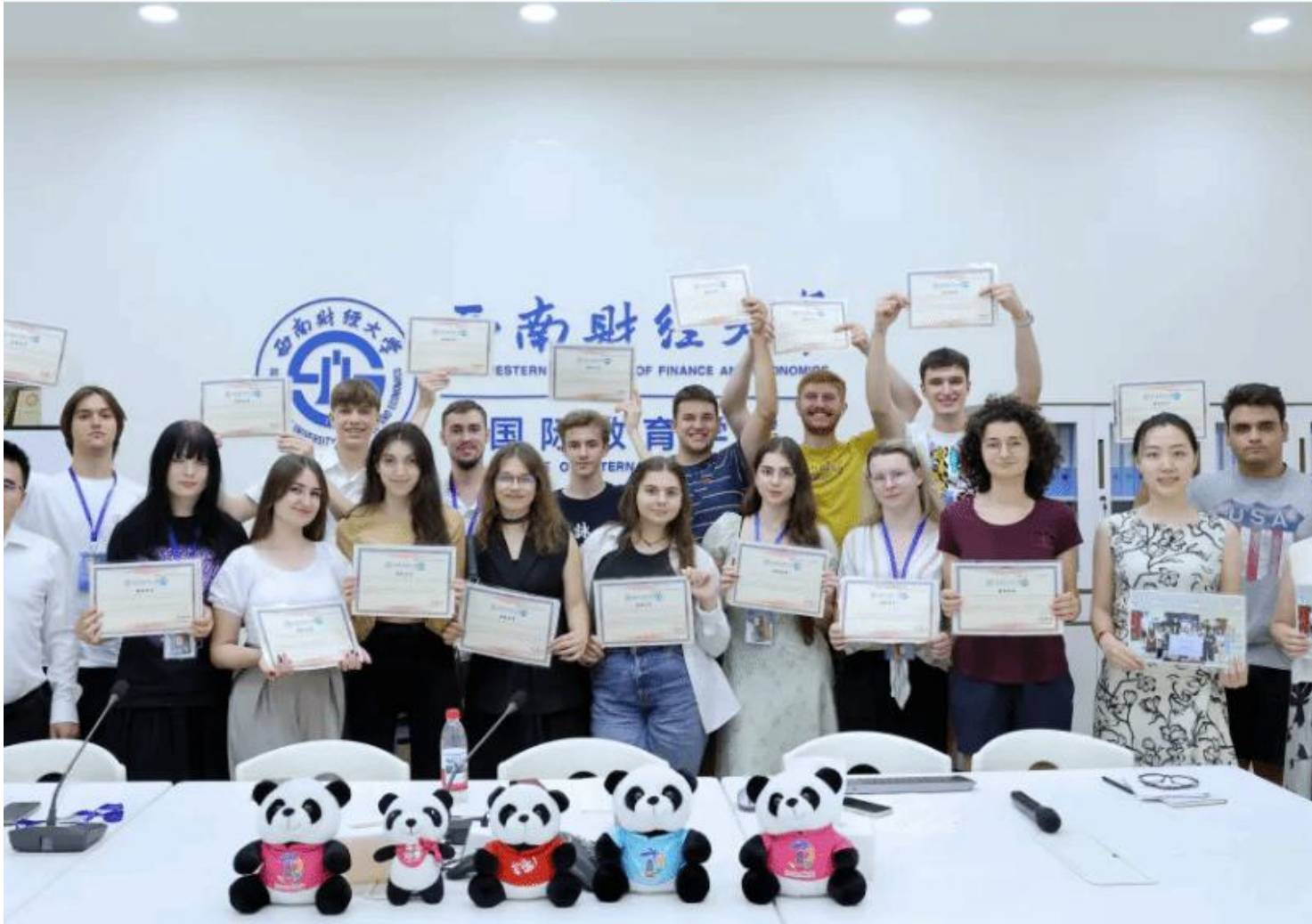
北马其顿圣基里尔—麦托迪大学孔子学院“汉语桥”